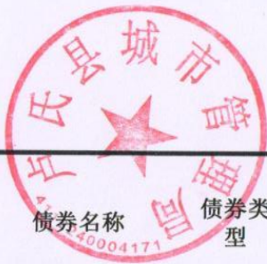
2020年--2021年末发行的新增地方政府专项债券情况表