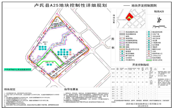
建设项目与控规关系图

说明 项目名称：卢氏县莘城中心养老院建设项目 项目位置：西苑路与洛北大渠交叉口东北角 总规用地性质：社会福利设施用地 控规用地性质：社会福利设施用地 用地规模：总用地面积为1.3530公顷 其中：建设用地面积：1.3530公顷