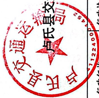
卢氏县交通运输局 2022 年度其他行政执法行为实施情况统计表