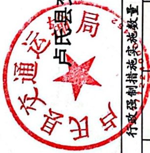
卢氏县交通运输局 2022 年度行政强制措施实施情况统计表